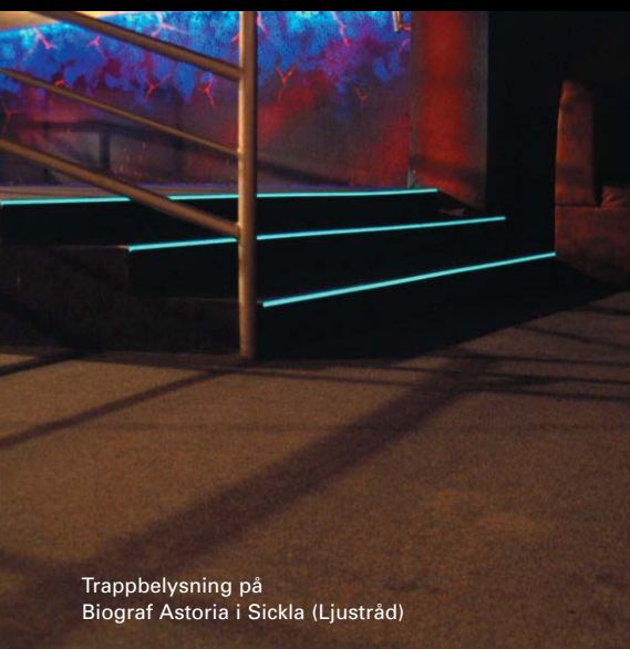
Trappbelysning på Biograf Astoria i Sickla (Ljustråd)