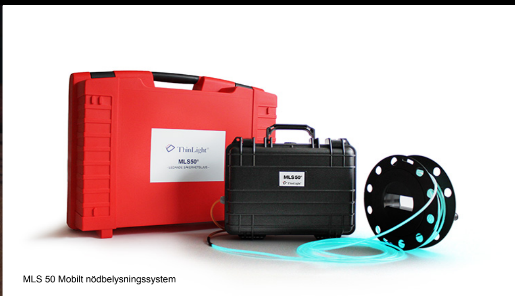
MLS 50 Mobilt nödbelysningsystem